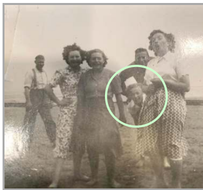
Als tiener met de buurtjeugd