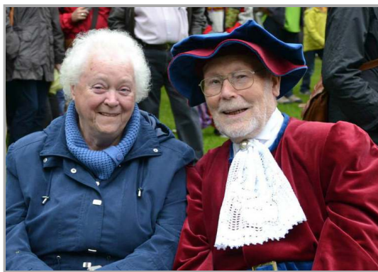
De belleman in 2017