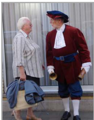
Met echtgenote in 2008