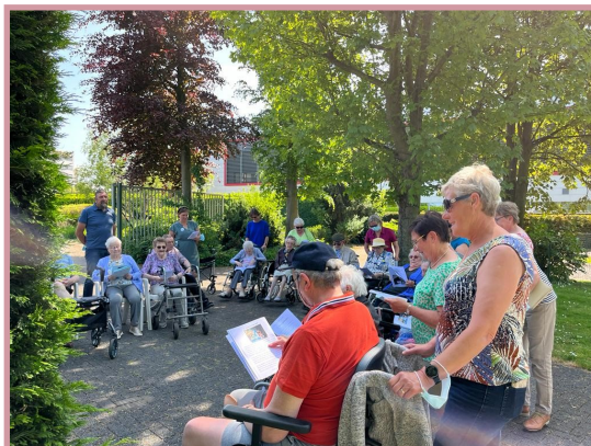
Beeweg in de tuin.